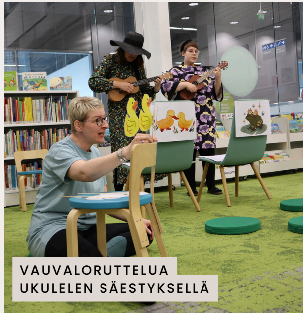
VAUVALORUTTELUA UKULELEN SÄESTYKSELLÄ

Kirjastolle löytyi vihdoin kaksi lukukoira. Lukukoiran vastaanottoja on pidetty säännöllisesti ja ne ovat olleet pidettyjä. Lukukoiralle lukeminen on osa kirjaston lukemaan innostamisen tehtävää. Lukutuokiossa lapsi lukee koiralle lukukoiran ohjaajan kanssa ja koira rentouttaa ja lievittää lukemisen mahdollisesti aiheuttamaa stressiä. Koira ei arvostele eikä korjaa lukemista.